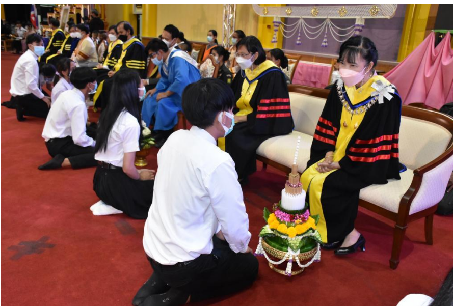
รายงานผลการประเมินโครงการพิธีไหว้ครูและพิธีบายศรีสู่ขวัญ ประจำปีการศึกษา 2565