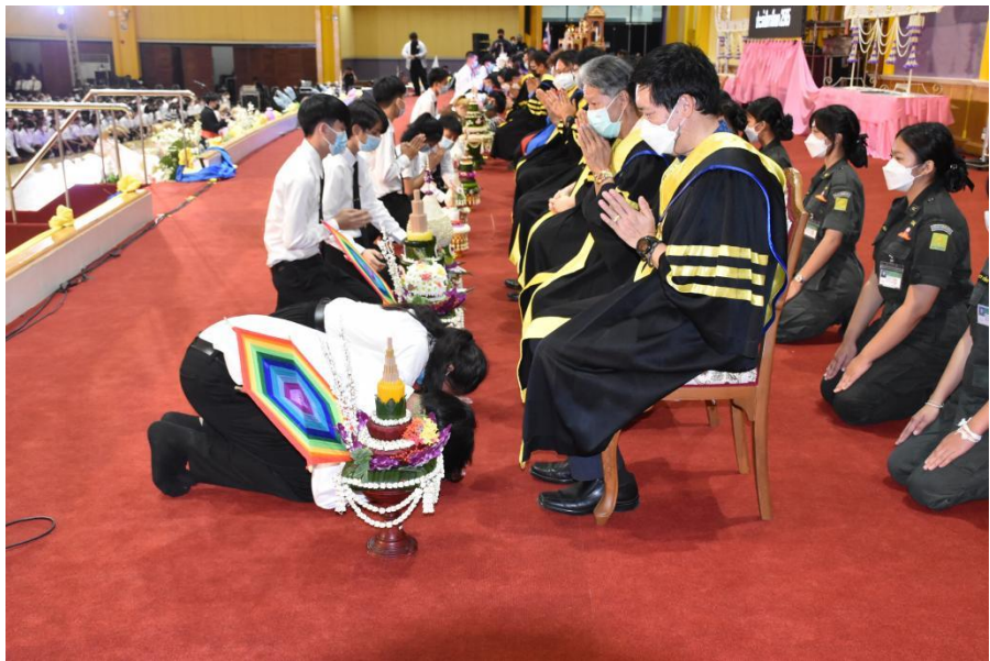
รายงานผลการประเมินโครงการพิธีไหว้ครูและพิธีบายศรีสู่ขวัญ ประจำปีการศึกษา 2565