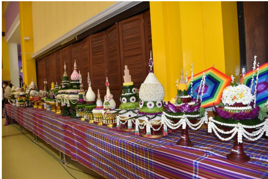
รายงานผลการประเมินโครงการพิธีไหว้ครูและพิธีบายศรีสู่ขวัญ ประจำปีการศึกษา 2565